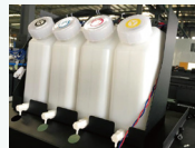
220cc二级墨盒+3L墨桶提供稳定的打印速度