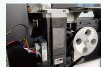
高品质直流伺服电机稳定性好使用寿命长