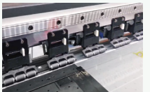
三压轮结构,带来更稳定的走料精度