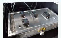
自动保湿清洗组件,保证清洗的稳定性,提供工作稳定性;