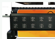
前置+底部红外烘干系统