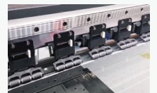
三压轮结构,带来更稳定的走料精度