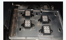
自动保湿清洗组件,保证清洗的稳定性,提供工作稳定性;