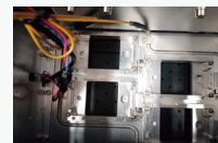
小车增加底板加热,有效提高打印的稳定性