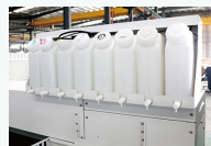
220cc二级墨盒+3L墨桶提供稳定的打印速度