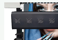
内置加热器和冷却风扇