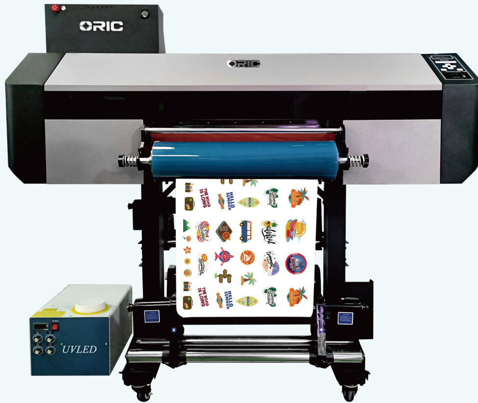
个性水晶标签批量打印 自动收放料系统